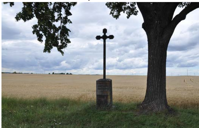
obr. Křížek U Pokorných v Mírovicích