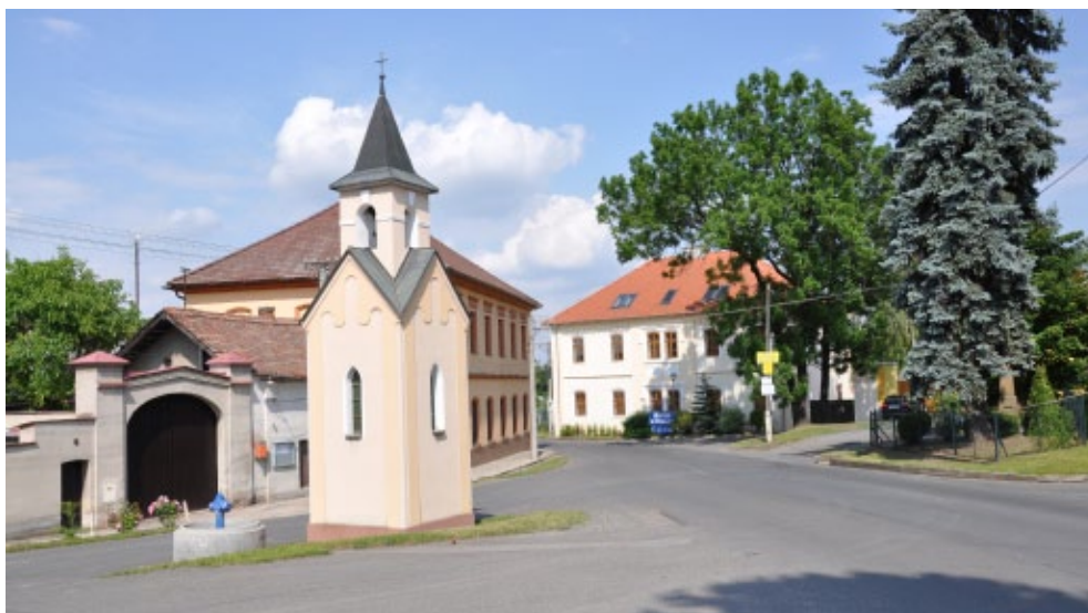
obr. Kaplička na návsi v Mírovicích a pomník obětem 1. světové války

Ačkoliv ve Veleni je historicky doložena existence minimálně jedné nebo spíše několika tvrzí, do dnešních dob se nedochovaly žádné významnější památky. Z hlavní tvrze zůstal pouze ve sklepě bývalého domu č. 33 vchod do tajné chodby, dnes zasypané a zazděné.