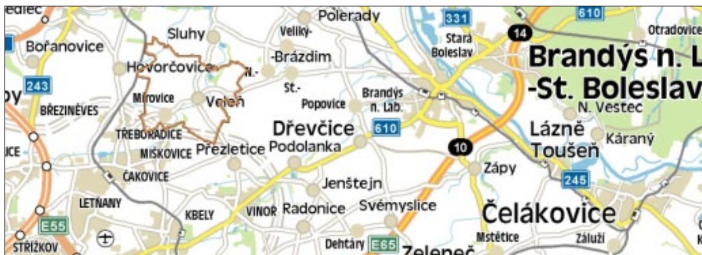
Obr. č. 1 Poloha obce v ČR

GPS poloha: 50°10'17.800"N, 14°32'51.382"E